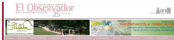
Medio Megabanner. Formato: 490x90ppp.