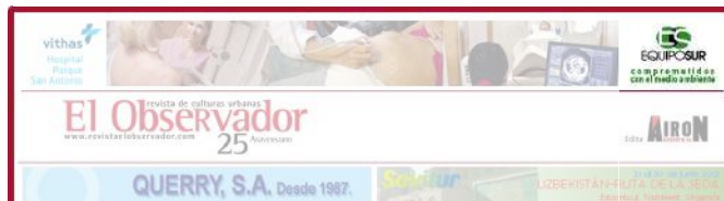
Botón superior cuadrado. Banner situado en la parte superior derecha de la cabecera de EL OBSERVADOR, junto al Megabanner. Segundo anuncio en importancia. Formato: 145x90ppp.

Botón superior cuadrado 750€/10 días ( iva)