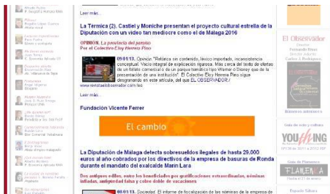
Banner intercalado entre noticias. Rectángulo posicionado en la columna central del Envío de Noticias y de la página web. Formato: 490x90.

Banner PRINCIPAL intercalado entre noticias 750€/10 días ( iva)