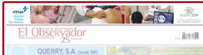
Megabanner. Formato: 820x90ppp.

Diversos porcentajes según tipo y duración de la inserción. Contactar.