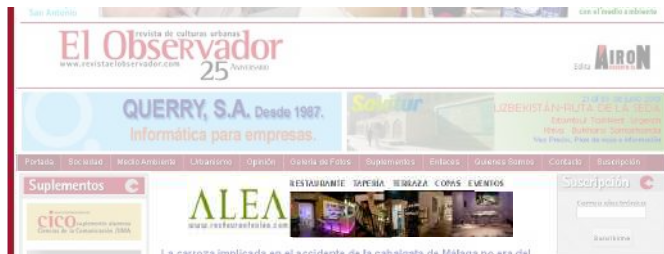
Banner Principal. Situado justo antes del primer titular. Formato: 490x90.

Banner PRINCIPAL intercalado entre noticias 750€/10 días ( iva)