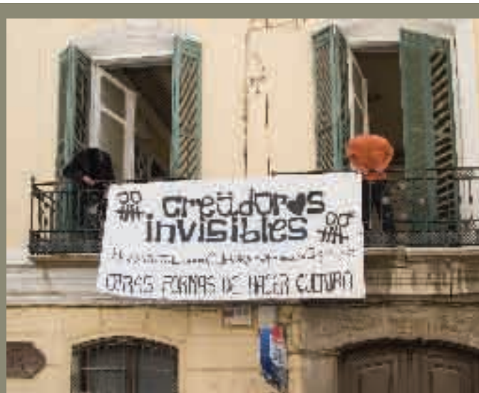
Ocupación del edificio de calle Nosquera, 9-11, después La Casa Invisible

Los Creadores Invisibles y, más allá, el barrio y el Centro Histórico necesitan el pulmón cultural y social en que se ha convertido ya por mérito propio esta Casa Invisible. Nuestro proyecto muestra qué es lo que está por venir en este espacio y ha de ser entendido como una defensa de las iniciativas culturales que nacen de una matriz ciudadana, y no ya de artificiales incubadoras, tal y como expresaba la periodista Esperanza Peláez hace unas semanas a propósito de La Casa Invisible: «Resulta paradójico asesinar la vida que surge espontáneamente en nombre de la fecundación in Vitro (misterios de la evolución). Los poderes públicos tendrían que abrir los ojos, rendirse a la evidencia de que las plantas que brotan en las grietas de los muros son más resistentes que las flores ornamentales que se plantan en las glorietas, escuchar a esos seres invisibles que gritan que la ciudad es de quienes la habitan y la mantienen viva».