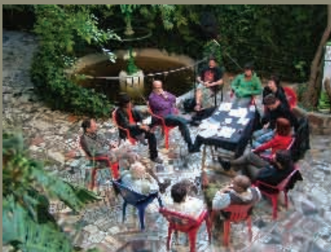
Taller de derivas urbanas en el patio de La Casa Invisible