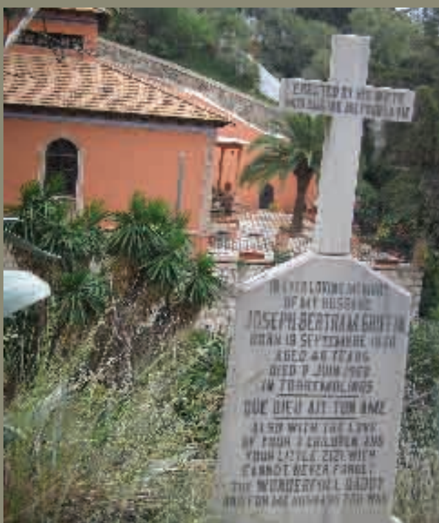
Vistas del interior del Cementerio Inglés.

Me invade un sentimiento de quietud, casi dulce, con un fondo de trinos de pájaros que son contrapunto del tráfico denso del Paseo de Reding y la Avenida de Pries que están abajo, pero que está acompañado de una sensación indescriptible de suave melancolía paradójicamente inquieta.