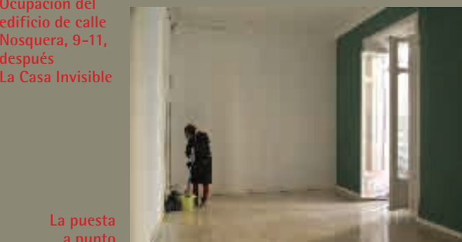
La puesta a punto